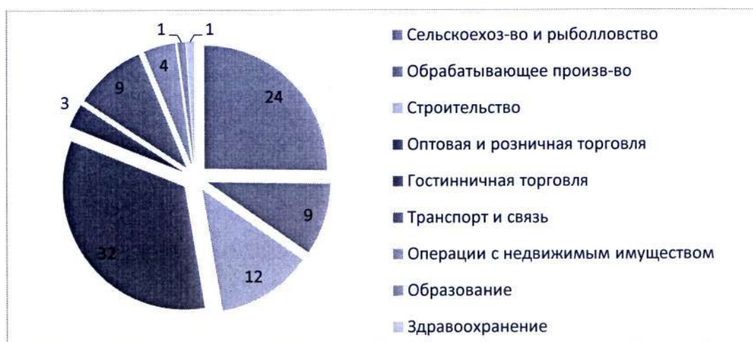
Рисунок 2 – Распределение занятых в теневой экономике – %

Стоит отметить то, что наименьшее распространение теневой экономики зафиксировано именно в образовательной деятельности и здравоохранении – 1%. Это связано с тем, что в данных секторах наибольшую долю составляют государственные учреждения, которые оказывают данные услуги.[12]