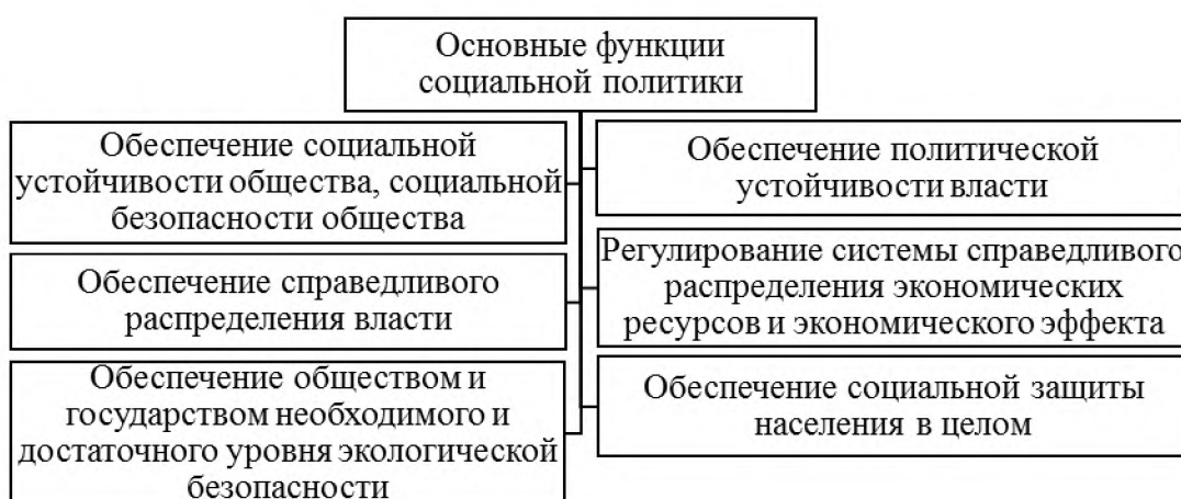
Рисунок 1.2 – Основные функции социальной политики государства

Содержание социальной политики, ее цели и задачи раскрываются в системе функций – относительно самостоятельных, но тесно связанных видов политической деятельности. На рисунке 1.2 представлены основные функции социальной политики государства.