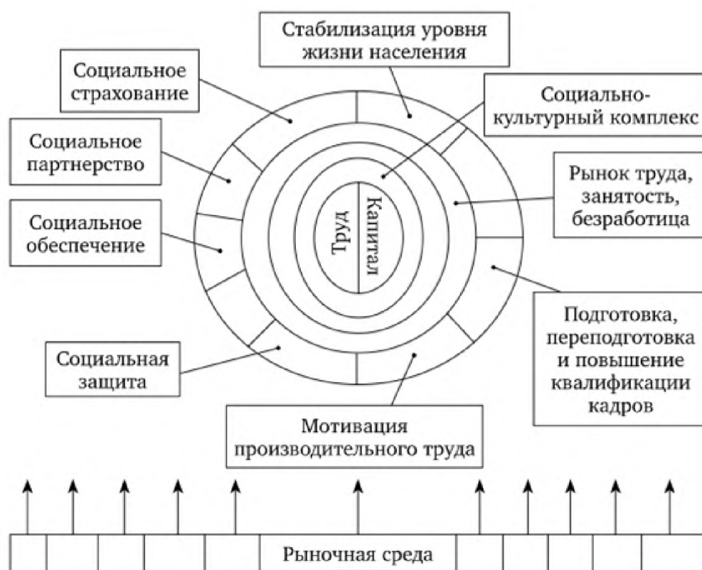
Рисунок 1.1 – Примерная структура социально-трудовой сферы

Шайдукова Л. Д. выделяет примерную структуру социально-трудовой сферы, представленной на рисунке 1.1 [21].