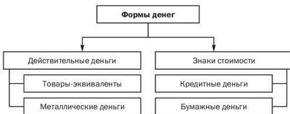
Рисунок 1. Формы денег