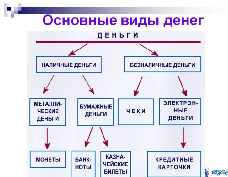
Рисунок 2. Виды денег.

Видом средств именуется отдел средств по природно-многофункциональному свойству. Принято акцентировать 3 ключевых типа средств: товарные финансы, полноценные финансы, неразменные финансы. В рамках вида средств акцентируются денежные формы. Формой средств именуется наружное выражение (исполнение) определенного типа средств. Таким образом, к примеру, нынешние кредитные финансы обладают несколькими конфигурациями воплощения: бумажные финансы, депозитные финансы, электронные финансы. Товарные финансы и их формы. Большая часть типов средств, использовавшихся на ранних стадиях развития сообщества, представляли собою предметные валютные знаки, либо товарные финансы. Товарные финансы – такой тип средств, олицетворяющий собою настоящие продукты, выступающие в качестве областного эквивалента, покупательная способность каковых основывается на их товарной цене. Допускается отметить 3 ключевых подвида товарных средств: