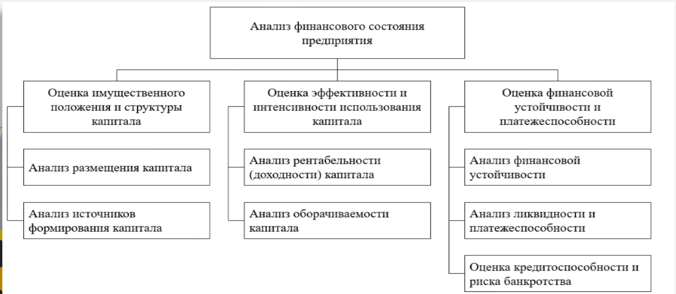
Диаграмма анализа фин. состояния предприятия