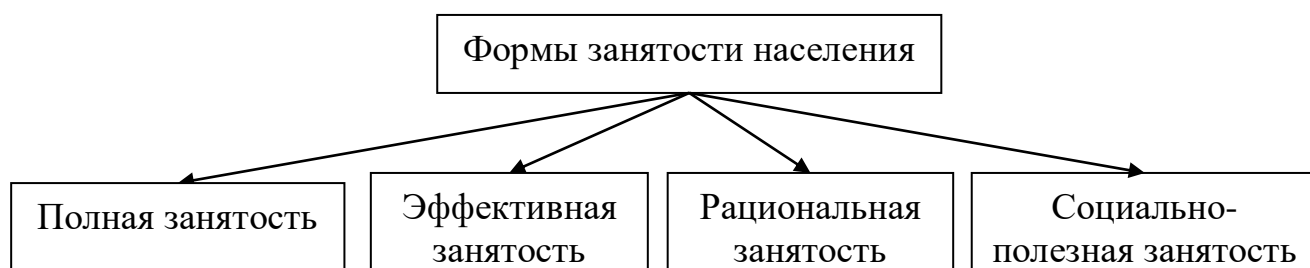
Рисунок 1 – Формы занятости населения [9]

В экономике выделяют несколько форм занятости населения [1]. В зависимости от качественных характеристик занятость бывает полная, продуктивная (эффективная), рациональная и социально-полезная. Графически это показано на рисунке 1.