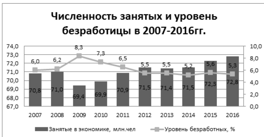
Рисунок 3 – Численность занятых жителей страны и уровень безработицы в 2007-2016 гг. [17]

Также важно отметить, что по данным Росстат численность безработного населения страны уменьшилась в декабре 2017 г. и составила 3,876 млн. человек (5,15% от общего количества экономически активного населения страны), а на начало 2018 года так же фиксировано снижение уровня безработицы, что, безусловно, указывает на оздоровление экономики и ее устойчивый рост [17].