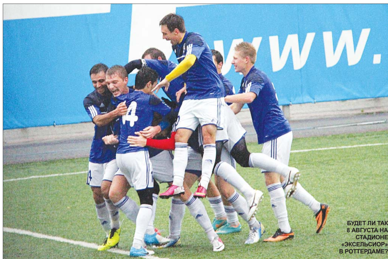
БУДЕТ ЛИ ТАК 8 АВГУСТА НА СТАДИОНЕ «ЭКСЕЛЬСИОР» В РОТТЕРДАМЕ?