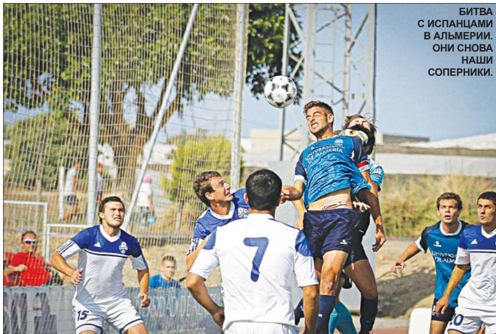
БИТВА С ИСПАНЦАМИ В АЛЬМЕРИИ. ОНИ СНОВА НАШИ СОПЕРНИКИ.