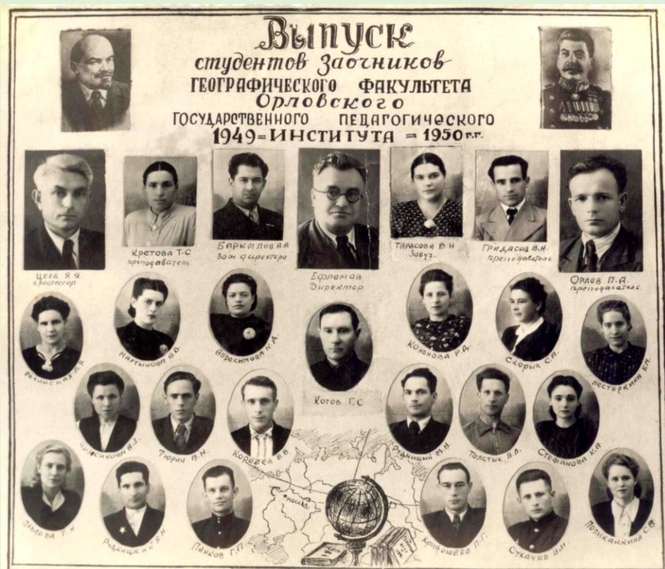
Выпуск Орловского государственного педагогического института. 1950 г.