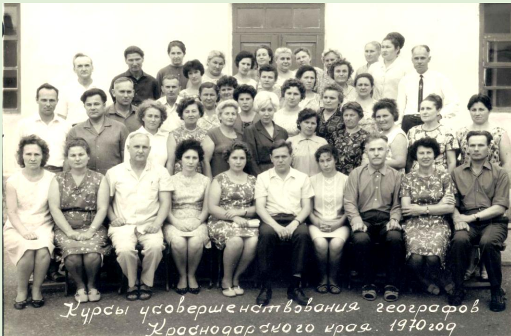
Курсы усовершенствования квалификации географов Краснодарского края. 1970 г.