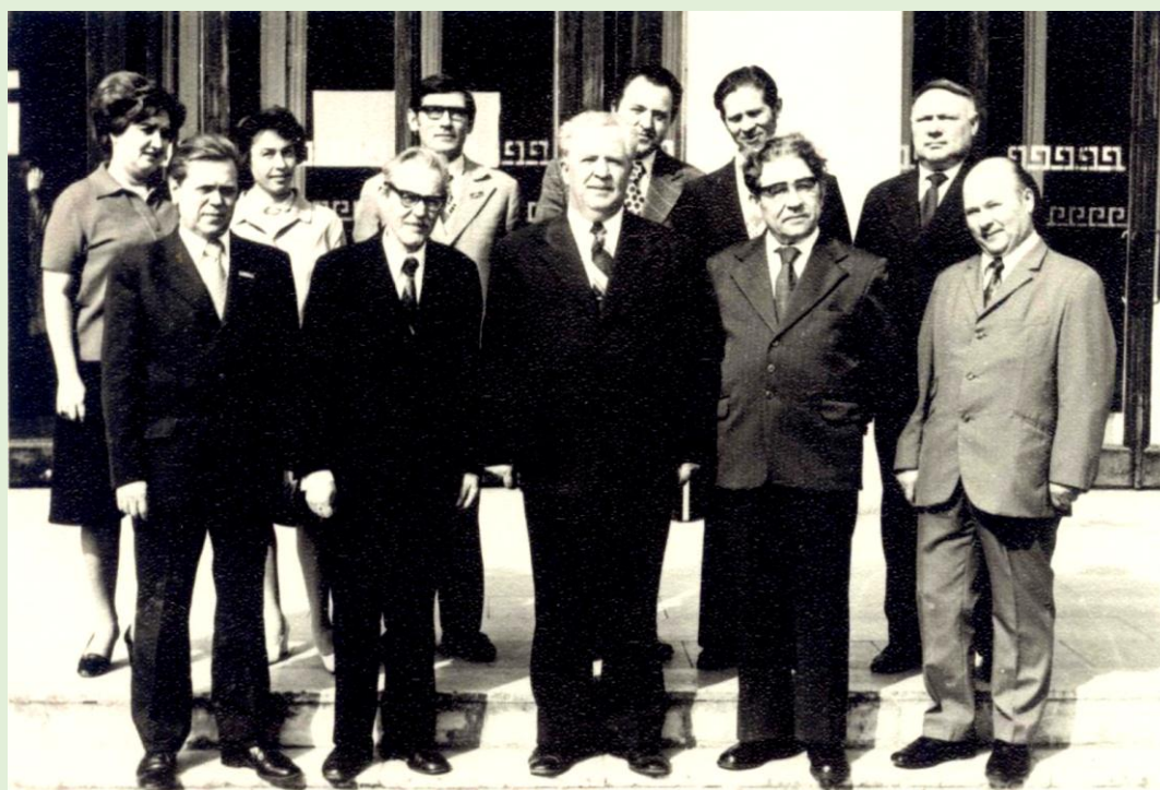
Коллектив кафедры экономической географии КубГУ. 1972 г.