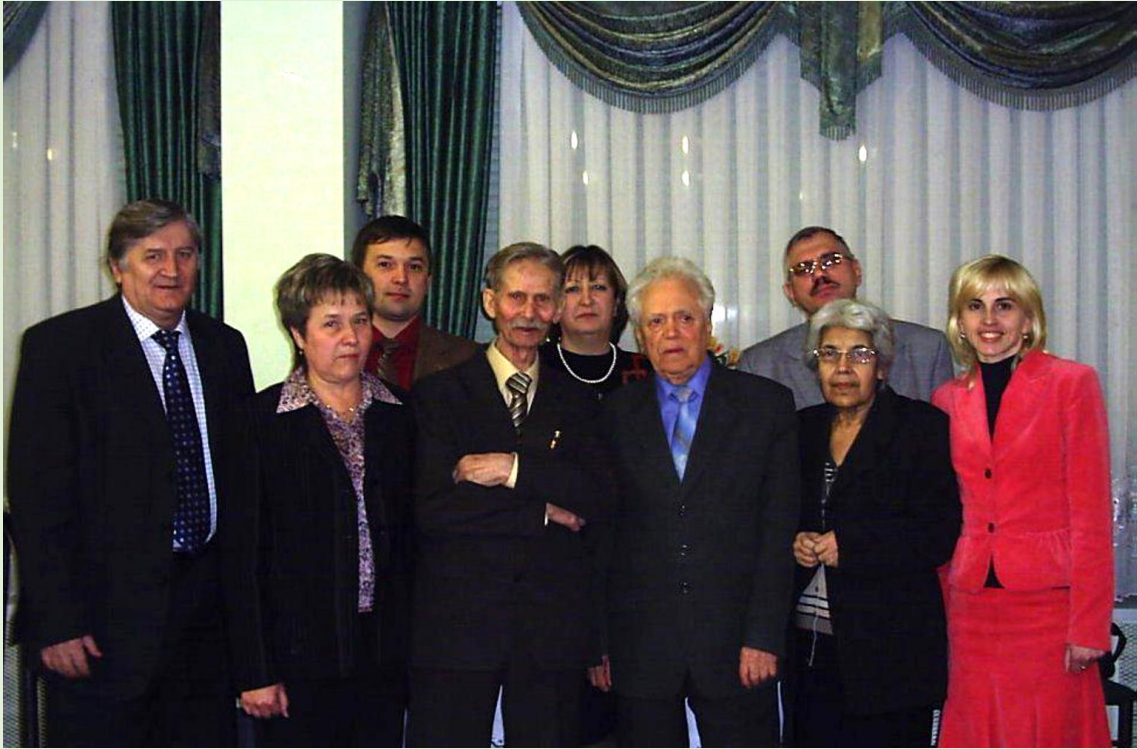
Сотрудники кафедры экономической, социальной и политической географии КубГУ. 2007 г.