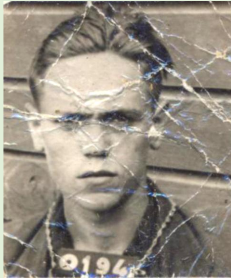
Концлагерь. В.Н. Тюрин. 1942 г.