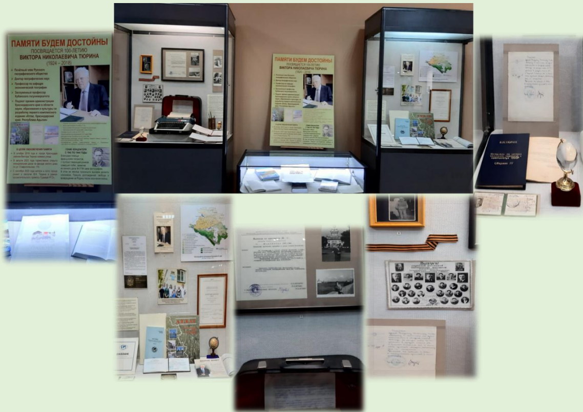
Выставка «Памяти будем достойны» в Краснодарском государственном историко-археологическом музее-заповеднике им. Е.Д. Фелицына, посвященная В.Н. Тюрину. 2024 г.