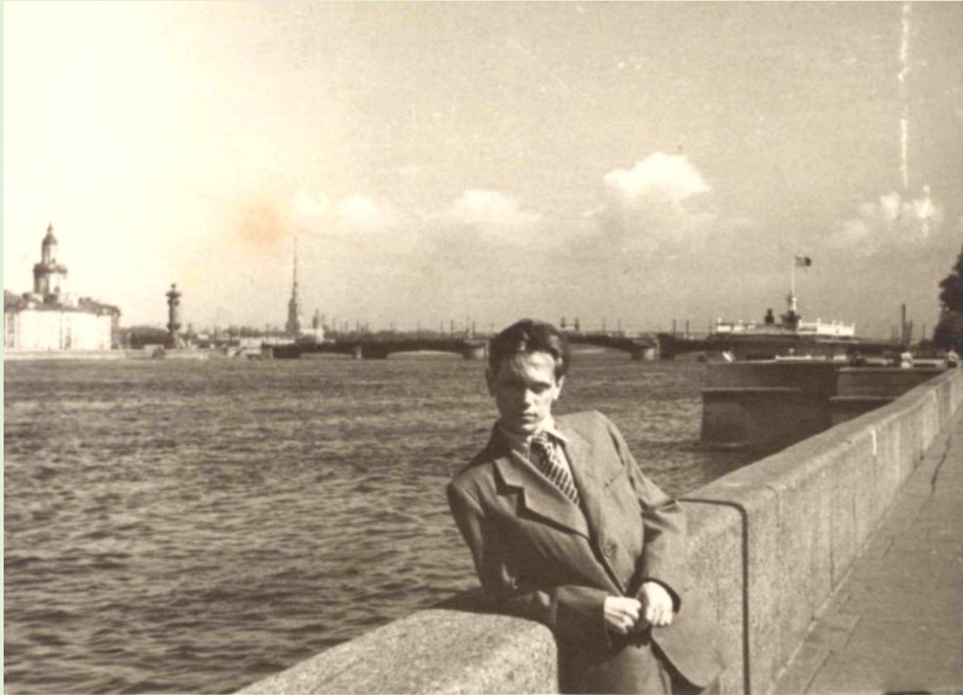
День зачисления в аспирантуру. г. Ленинград. 15 августа 1954 г.