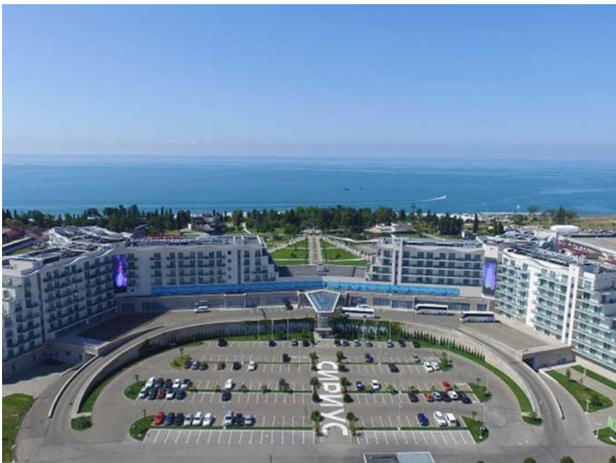
Образовательный центр «Сириус»