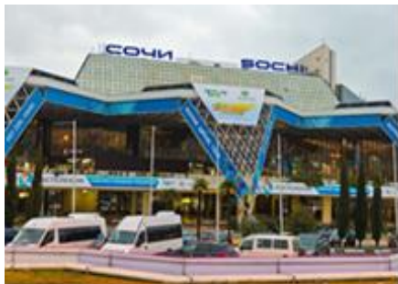
Аэропорт Сочи (Адлер)