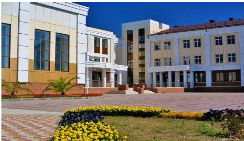
Школа № 100 (Адлер) – место проведения торжественной церемонии закрытия Олимпиады