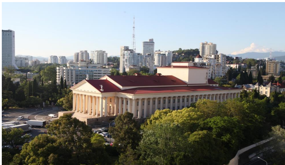
Зимний театр г. Сочи – место проведения торжественной церемонии открытия Олимпиады