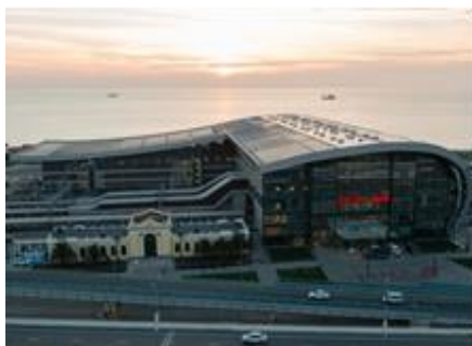
Железнодорожный вокзал Адлер