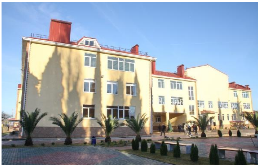
Школа № 38 (Адлер) – место проведения соревновательных туров Олимпиады