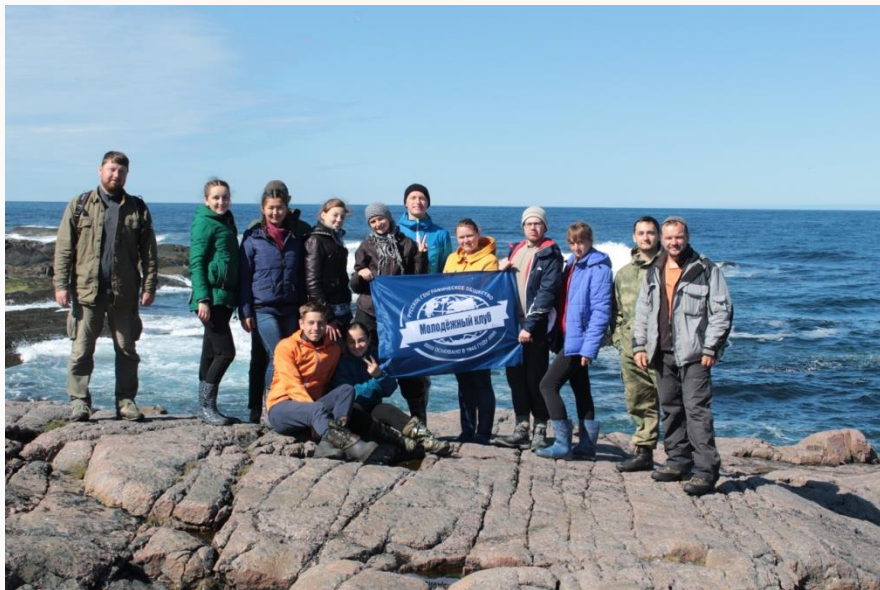
Териберка Мурманская область