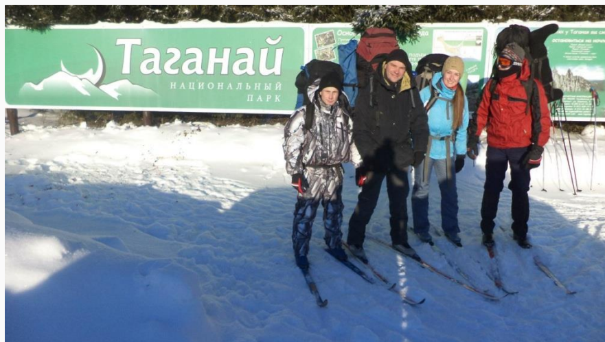
«Таганай», Челябинская область