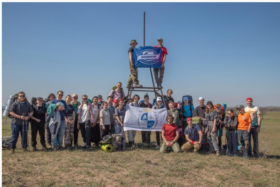
о. Сарпинский, Волгоград