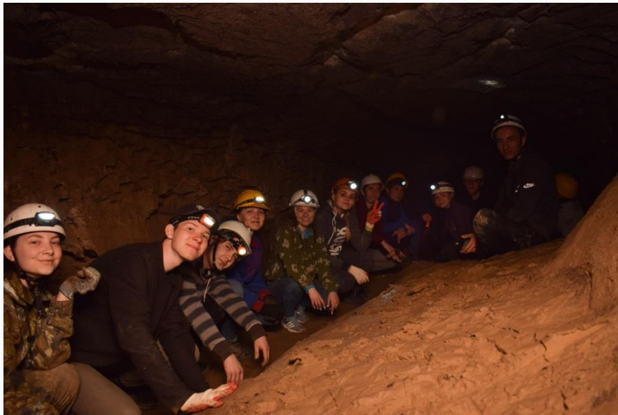
Пещера «Студенческая» Астраханская область