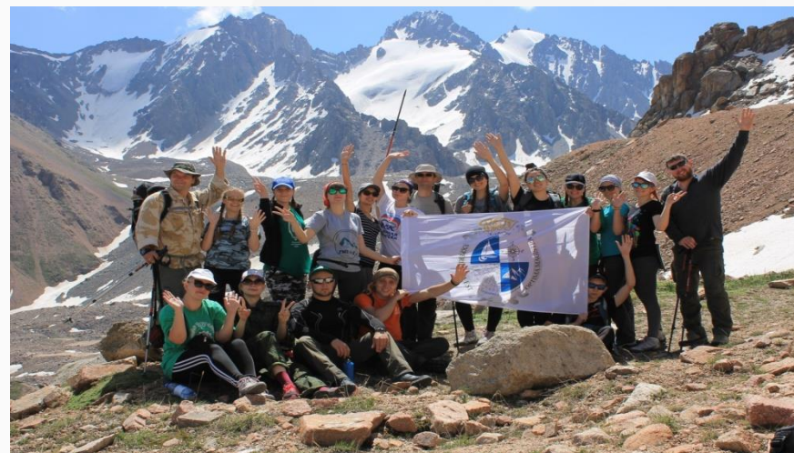
Северный Тянь-Шань Казахстан