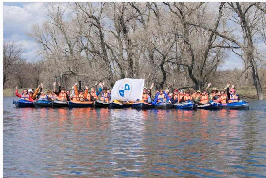
р. Медведица Волгоградская область