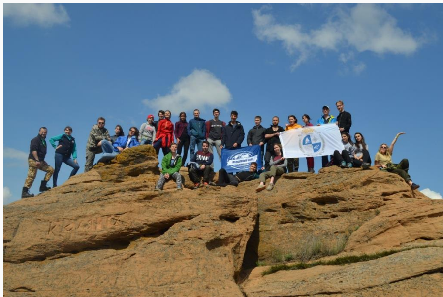
г. Богдо, Астраханская область