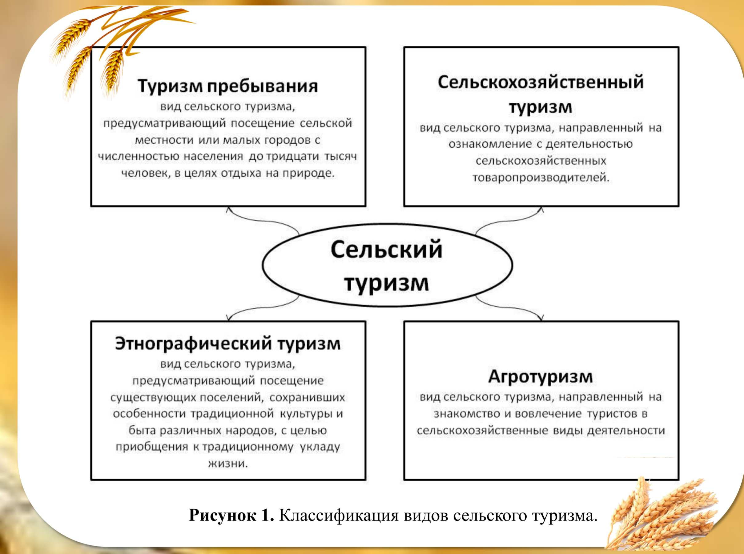
Рисунок 1. Классификация видов сельского туризма.

Таким образом, новое понятие федерального закона не отождествляет понятия сельского и аграрного туризма. Следовательно, в Российской Федерации, аграрный и сельский туризм, хоть и являются родственными, но все-таки определяются как разные виды экономической деятельности.