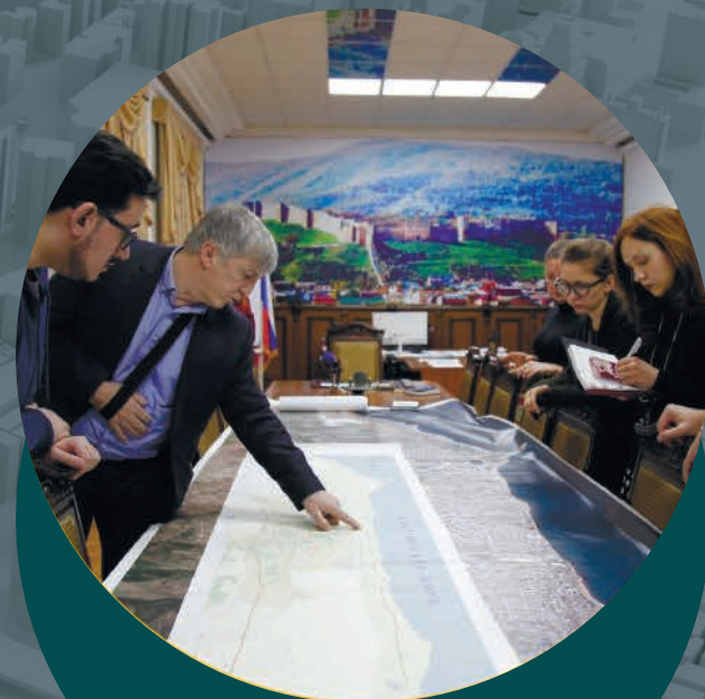
УРБАНИСТИКА СЕЙЧАС МАСТЕР-ПЛАН

МАСТЕР-ПЛАН - ЭТО НЕ НАБОР ГРАДОСТРОИТЕЛЬНЫХ КАРТ, ФИНАНСОВЫХ МОДЕЛЕЙ И ТРАНСПОРТНЫХ СХЕМ, А ИНСТРУМЕНТ ПРОЕКТИРОВАНИЯ БУДУЩЕГО ЛЮДЕЙ.