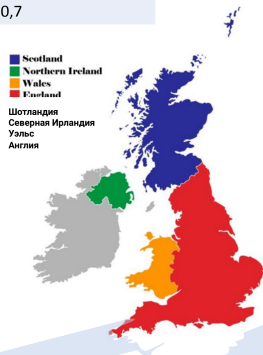
Рисунок 2 – Административно-территориальное деление Великобритании