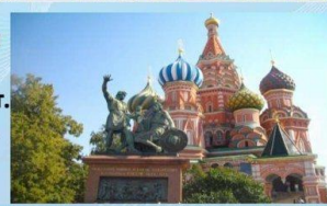
Известные исторические памятники России