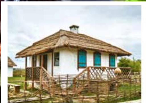
Этнографический комплекс «Кумжа»