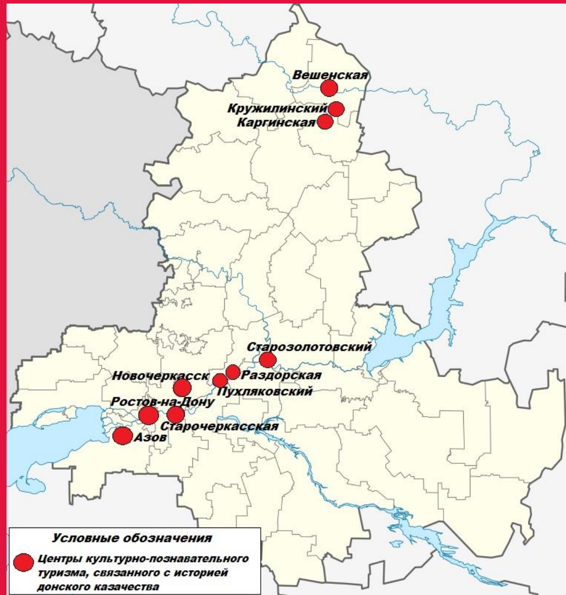
(рис.1 – картосхема центров культурно-познавательного туризма Ростовской области, связанного с историей донского казачества; составлено автором)