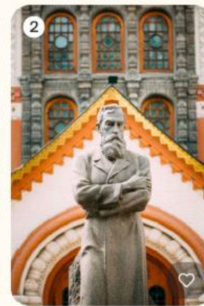
2 МУЗЕИ Третьяковская галерея на Дарвиновском