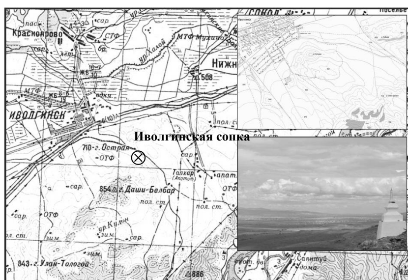
Рис. 1 – Картосхема расположения объекта «Иволгинская сопка» [Экологическая паспортизация..., 2015]

Главной природной достопримечательностью района является Иволгинская сопка – колоритное возвышение, по форме напоминающее голову (бурятское название горы – Баин-Толгод). Ее западный склон скалистый, а восточный гладкий. У подножия горы находилась пещера с десятками выходов. Сопка является священным местом, и местом отдыха местных жителей. Имеет категорию – геологический памятник природы (утвержден решением Совета Министров Бурятской АССР №304 от 14 октября 1980 г.).