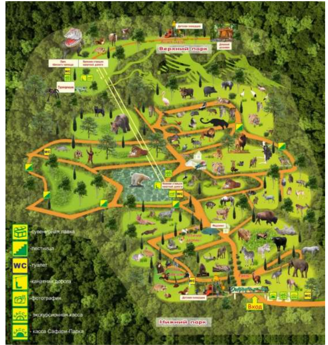
Фото объекта, фрагментов

Назначение и использование: Геленджикский «Сафари-парк» – первый на Черноморском побережье реабилитационный центр для животных.