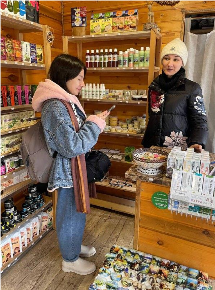
Во время интервьюирования в с. Чемал