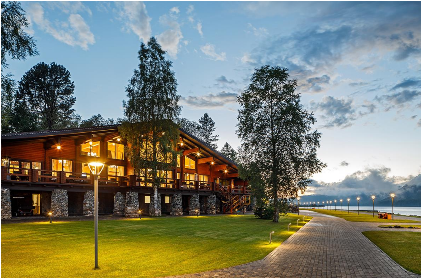
Трансформация социокультурной среды под воздействием туризма

3. Изменение социокультурных условий. Туризм оказывает трансформирующее воздействие на традиционное сознание и образ жизни местного населения. Приезжающие в Республику Алтай обеспеченные жители больших городов привносят иные образцы культуры мышления и поведения, жизненных ценностей. 32% всех респондентов считают, что массовый туризм в регионе формирует такую общественную среду, которая способствует развитию материализма, эгоизма, жадности и формированию потребительского мышления у местного населения. Сезонные скопления туристов и автотранспорта нарушают привычную для сельских жителей уединенность, размеренность жизни.