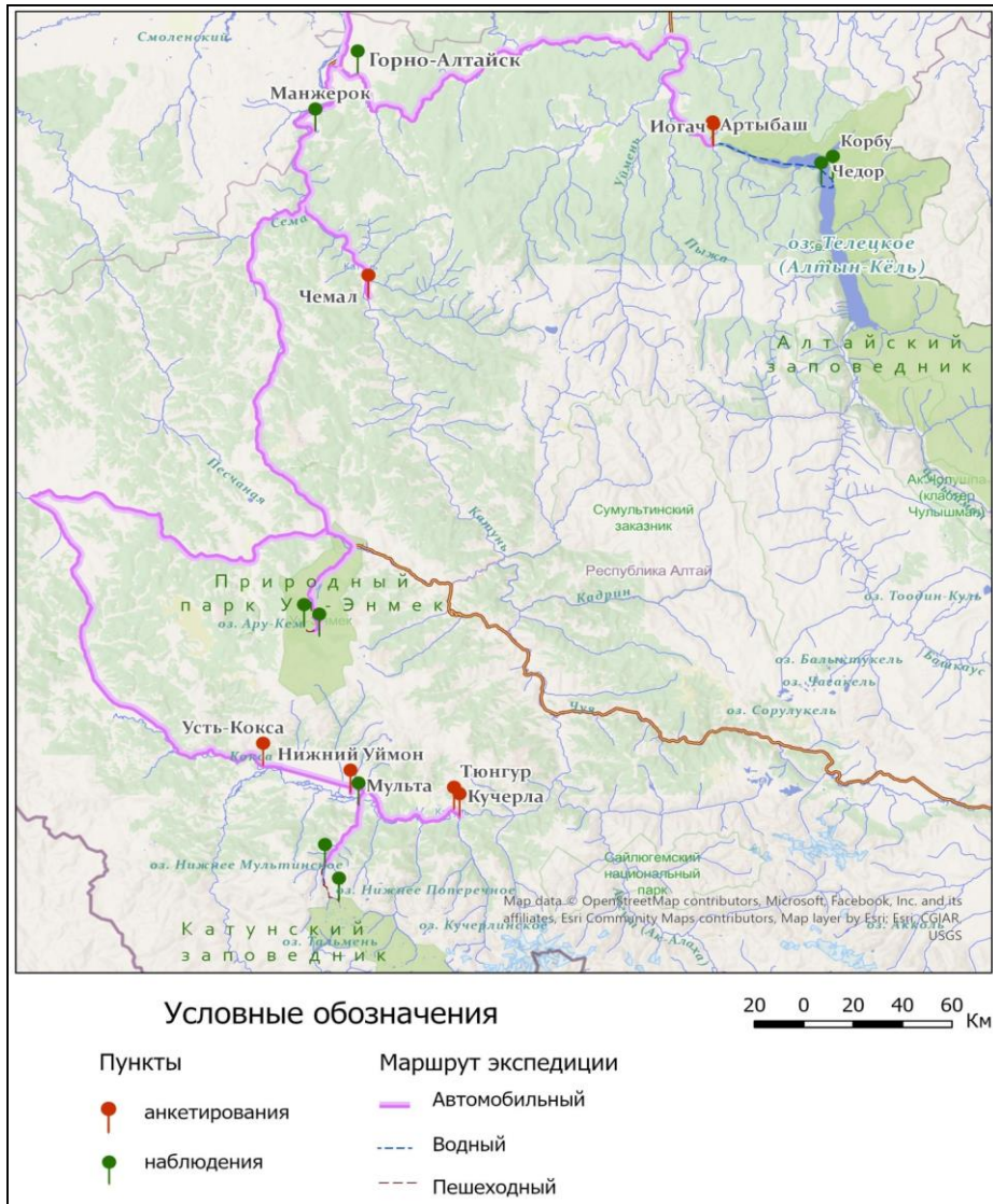
Общая карта-схема маршрута экспедиции

1. Невключённое наблюдение. По ходу маршрута фиксировались визуально выраженные проявления туристской деятельности, видоизменившие, в той или иной мере, местные культурные ландшафты. В популярных туристических местах (у экскурсионных достопримечательностей и на туристских тропах) закладывались точки описания. Фиксировались преобразующие естественный ландшафт элементы, связанные с туристской деятельностью. Отмечались объекты собственно туристской инфраструктуры (отели, турбазы, рестораны, горнолыжные спуски и пр.), результаты рекреационной дигрессии почвы (вытаптывание), объекты, видоизменяющие облик природного или культурного ландшафта – рекламные баннеры, надписи на скалах и камнях, мусор и пр. Эти индикаторы туристского воздействия на природные и культурные ландшафты территории вносились в общую базу данных, осуществлялось их описание, фотофиксация и геопозиционирование с помощью GPS. В общей сложности было описано 211 точек наблюдения.