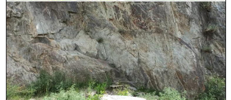
Примеры трансформации визуальной среды