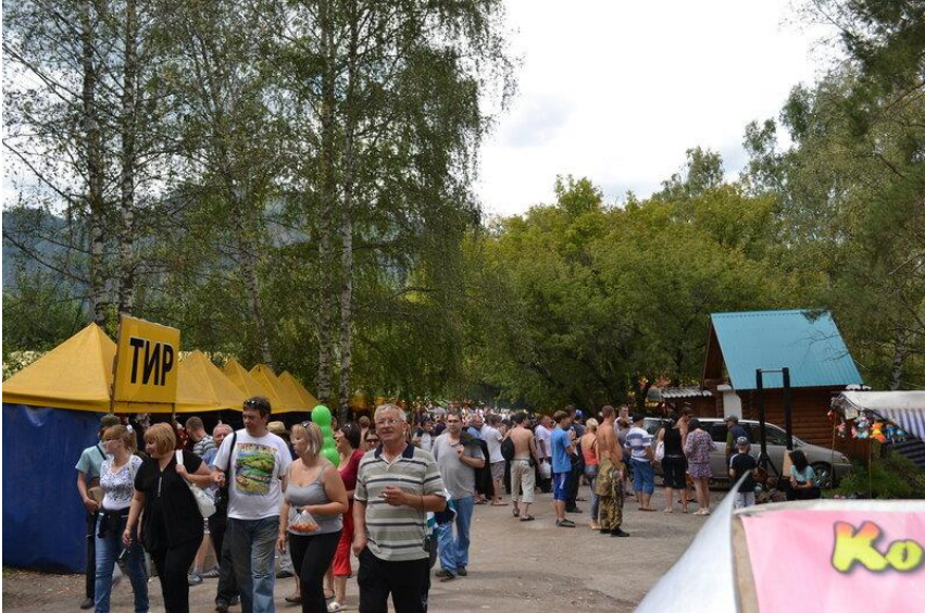
Примеры негативного влияния туризма на социально-экономическую среду региона

2. Туризм как драйвер изменения социально-экономических условий в регионе. Основная позитивная роль туризма местным населением Республики Алтай видится в расширении возможностей занятости и ведения бизнеса. В представлении большинства респондентов (82%) индустрия туризма на территории региона обеспечивает хорошие условия для получения высокой прибыли.