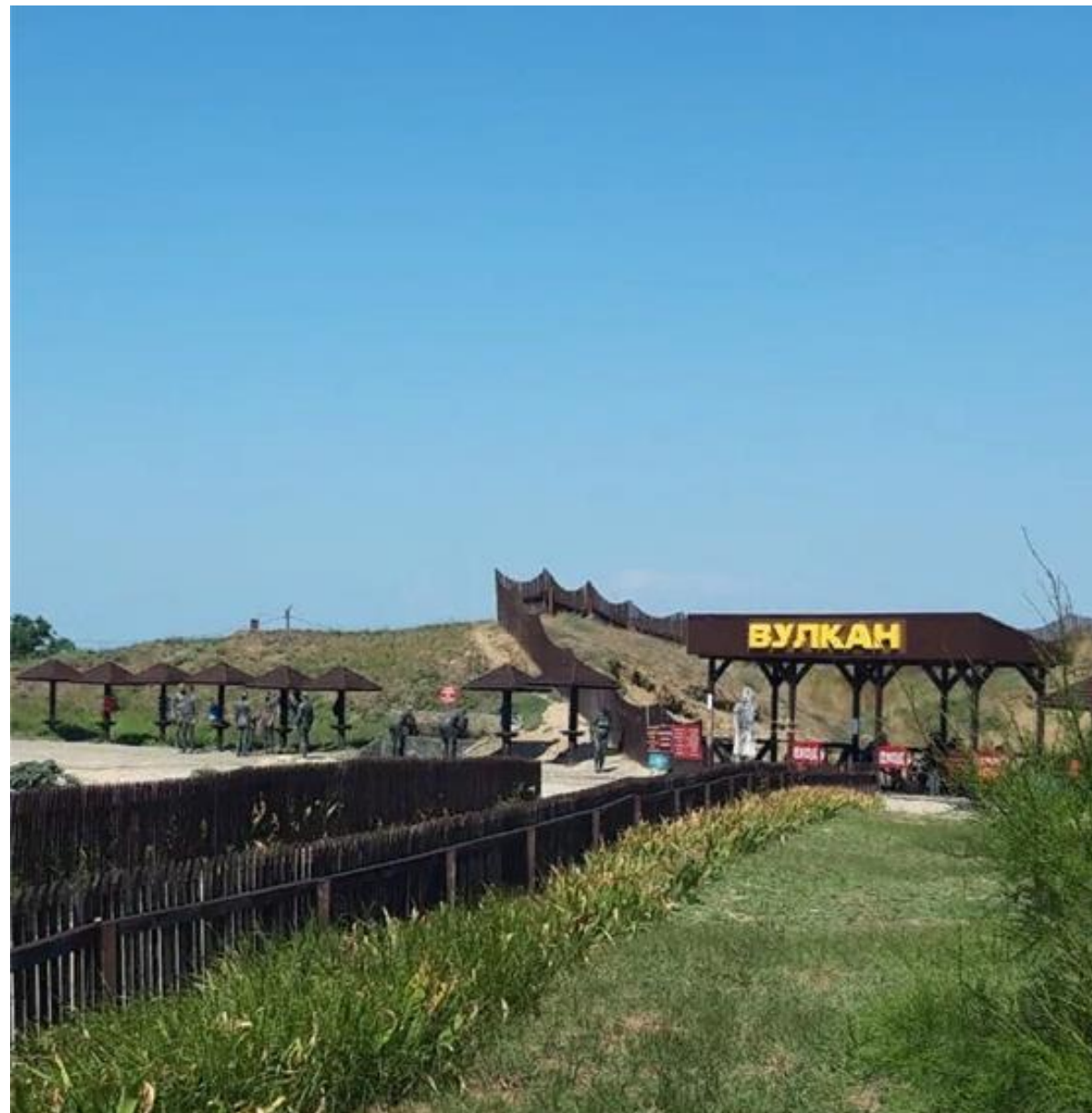
Вход к чаше(жерлу) грязевого вулкана

Прогнозируемые изменения: ежедневно из жерла вулкана выделяется до 2,5м 3 грязи, поэтому истощение вулкану в ближайшие годы не грозит.